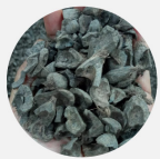
Cangkang Kelapa Sawit