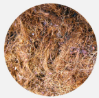
Serabut/Fiber Kelapa Sawit